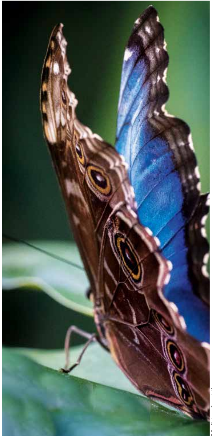
Himmelsfalter – der Schmetterling ist ein Auferstehungssymbol.

Spätestens an dieser Stelle beginnt der Glaube, sich in mir zu regen: Alles, was die Person unserer Verstorbenen ausmachte, ihre Seele, ihr Sein, ihre Person ist nun aufgehoben in Gott. Durch Jesus Christus wird er sie neu schaffen zur Auferstehung des Leibes, in einem Augenblick. Für die Verstorbenen schon jetzt, für uns noch nicht. Ein Funke Freude bricht sich Bahn, glimmt auf und beginnt einen Moment zu leuchten, und ich stelle überrascht fest: Freude und Trauer können offenbar gleichzeitig in mir sein. Eine Freude, die die Trauer zu überspringen und zu überspielen versucht, ist keine echte Freude. Trauer muss sein, ja, sie muss sein! Trauer